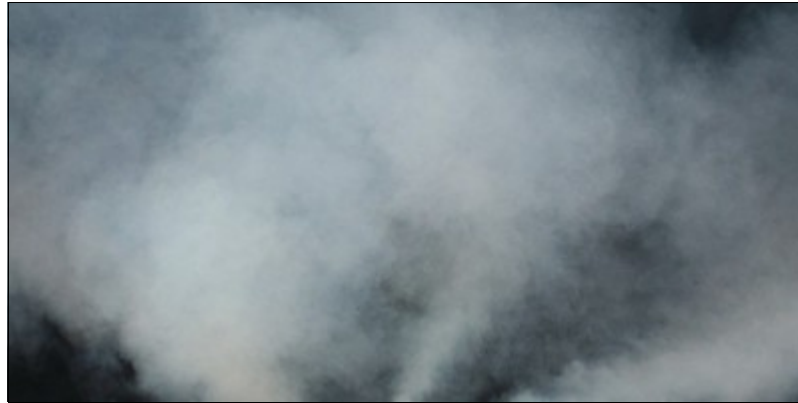
La fumée dans une soirée dansante

L'utilisation d'une machine à fumée ou à brouillard est appréciable en soirée. Toutes les discomobiles disposent de cet appareil qui diffuse une brume opaque ou plus légère selon les modèles et les liquides utilisés. L'avantage premier de la diffusion de fumée c'est qu'elle permet de faire apparaître les faisceaux lumineux projetés par les éclairages (lyres dynamiques, lasers et autres jeux de lumières). Cependant, l'utilisation de la machine à fumée doit se faire avec la plus grande modération. Certains DJ en sonomobile ont tendances à s'endormir sur la télécommande. Ce qui est fort regrettable. Pour animer une soirée , la machine à fumée c'est un gros plus mais il ne faut pas en abuser au risque de ne rien apercevoir non plus sur les photos réalisées.