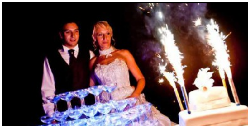
La présentation du dessert à un mariage

Bien que le rôle du deejay soit d'orienter le couple vers des titres efficaces qui contribueront à la bonne ambiance de la soirée , il ne doit en aucun cas imposer les musiques diffusées pour l'entrée en salle ou la présentation du dessert des mariés sous prétexte qu'il fait toujours comme ça. Encore une fois, il n'est pas là pour diffuser ses préférences musicales ! Non, il n'y a pas de musique obligatoire pour l'entrée en salle. Le couple ne doit pas non plus être contraint de choisir entre un titre phare de la discographie de Jean-Michel Jarre ou la célèbre musique Happy de Pharrell Williams. Oui, le choix de ces musiques revient aux mariés ! Ces instants de la soirée sont importants, il faut veiller à ne pas les négliger.