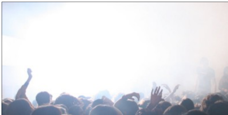
Le flash d'un stroboscope dans une soirée dansante

A moins d'animer un bal de jeunes, une free party, une soirée en discothèque ou dans un club électro, l'utilisation d'un stroboscope n'est pas réellement adaptée. Je ne suis pas certain que Mamie Huguette, qui fait l'effort de profiter de la fête, apprécie de se prendre des flashes de 3000 watts en pleine face. Dites-vous bien qu'une installation en discomobile doit être ajustée en fonction du public présent. A l'occasion d'une soirée privée de type mariage ou anniversaire, les invités présents sont généralement de différentes générations, il est donc important de respecter les personnes qui auraient du mal à s'accommoder à l'utilisation d'une lumière stroboscopique jugée trop agressive.