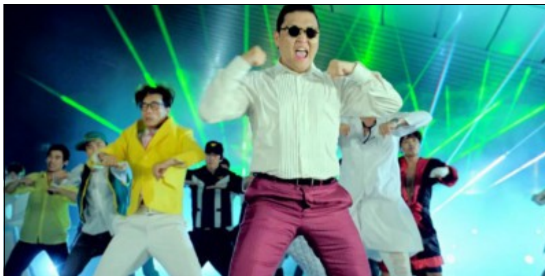
La chorégraphie de Gangnam Style par le chanteur Psy

Oui, vous avez bien lu ! C'est inquiétant lorsque l'on sait que certains animateurs de soirées sont capables de se transformer le temps d'un instant en professeur de danse en pensant qu'il est utile d'apprendre les chorégraphies de certaines musiques aux personnes présentes sur la piste. Il existe des prestataires qui vont encore plus loin en utilisant des accessoires comme des chapeaux, des perruques, des lunettes, ... Oui, ça fait peur ! Si les organisateurs recherchaient ce genre de prestations, ils se seraient directement adressés à un humoriste ou éventuellement à un clown dont c'est les métiers de faire rire. Rester simple est la meilleure des présentations.