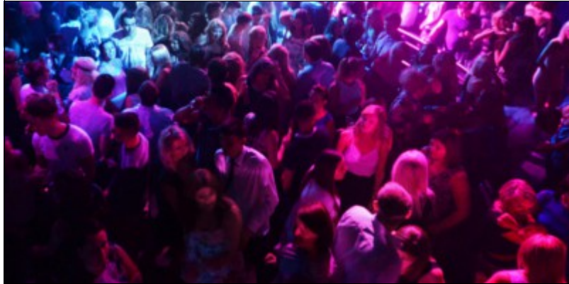
La piste de danse

Ne pas dire « oui » à toutes les idées de musiques demandées par les invités.