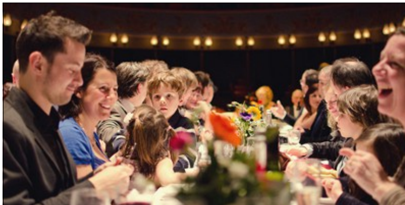
Les invités à table pendant le repas

A table, les invités doivent pouvoir échanger entre eux. Il n'y a rien de plus désagréable que de ne pas s'entendre parler. Les musiques diffusées doivent être calmes et faibles en basse afin de créer une atmosphère musicale en harmonie avec le thème de l'événement dans la continuité de l'apéritif. On juge que le volume de la musique est bien assez élevé lors de la soirée dansante donc autant qu'il reste faible au cours du repas et ainsi éviter de fatiguer trop rapidement les oreilles des invités présents. C'est l'occasion de diffuser les morceaux que les organisateurs apprécient d'écouter mais qui ne se dansent pas.