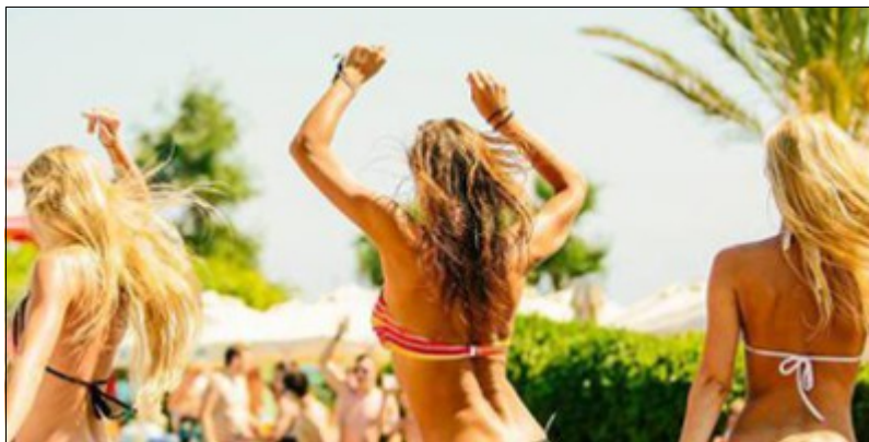
C'est la fête sur les plages de Novalja en Croatie

Ne pas diffuser de la musique qu'il est le seul à connaître.