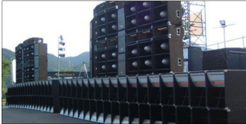
Une sono de malade

Le rôle d'un DJ n'est pas que de faire du bruit. Il doit savoir respecter le cadre qu'on lui met à disposition pour travailler tout en préservant l'audition de chacun des convives. La réglementation sur le niveau sonore dans les lieux recevant du public impose que le degré de pression acoustique ne dépasse pas 105 dB (A) de moyenne. A moins de sonoriser un bal populaire en plein air ou une scène du Teknival, il n'est pas utile d'intervenir avec un caisson de basse de la taille d'un frigo américain. Il est nécessaire de privilégier la qualité sonore à la puissance à condition qu'elle reste évidemment cohérente avec l'événement, la superficie de l'espace à sonoriser et le nombre de participants.