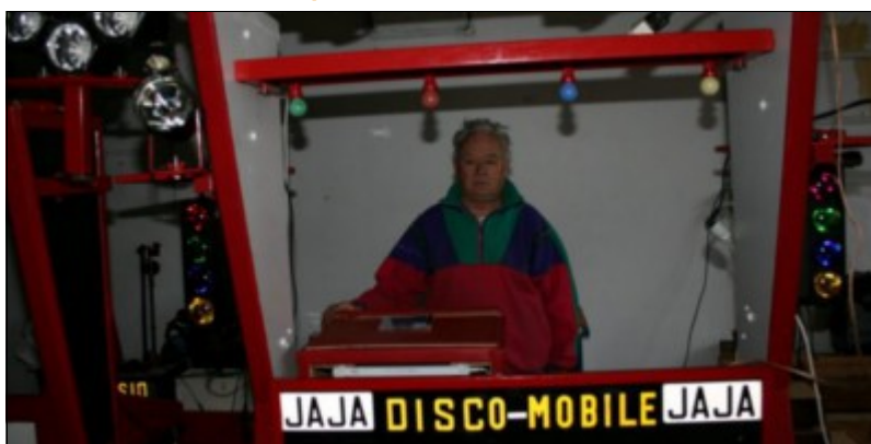
Jaja & sa discomobile

Attention ! Les DJ intervenants pour l'animation de mariages et de soirées dansantes privées sont nombreux à installer une horrible banderole pour cacher la câblerie indésirable en pensant rendre leurs installations plus présentables. Par la même occasion, ils ont la certitude que d'afficher le logo avec les coordonnées de la discomobile est profitable à leur communication. Il est tout à fait déplacé de profiter d'une soirée pour promouvoir son activité à moins de s'être engagé sur un événement sponsorisé. Ce qui est rarement le cas. Notre conseil est qu'il est préférable de tendre un drap dans une belle matière et de couleur unie voire d'utiliser un « cache-misère » spécialement conçu pour ce type de présentation.