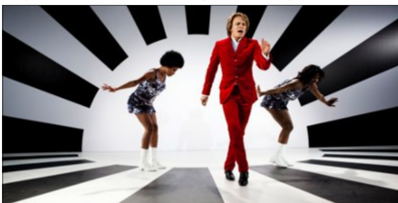
Le chanteur Claude François et ses Claudettes

Ne pas chanter par-dessus la musique et ne pas abuser du micro.