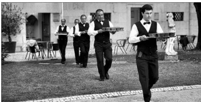
Stop la musique ! Les serveurs sont prêts pour le service...

Ne pas préciser au traiteur la durée des animations organisées entre les plats.