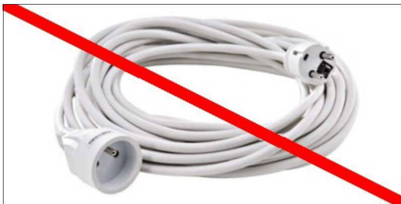
Pas de blanc dans l'événementiel

Ne pas utiliser une câblerie blanche et apparente.